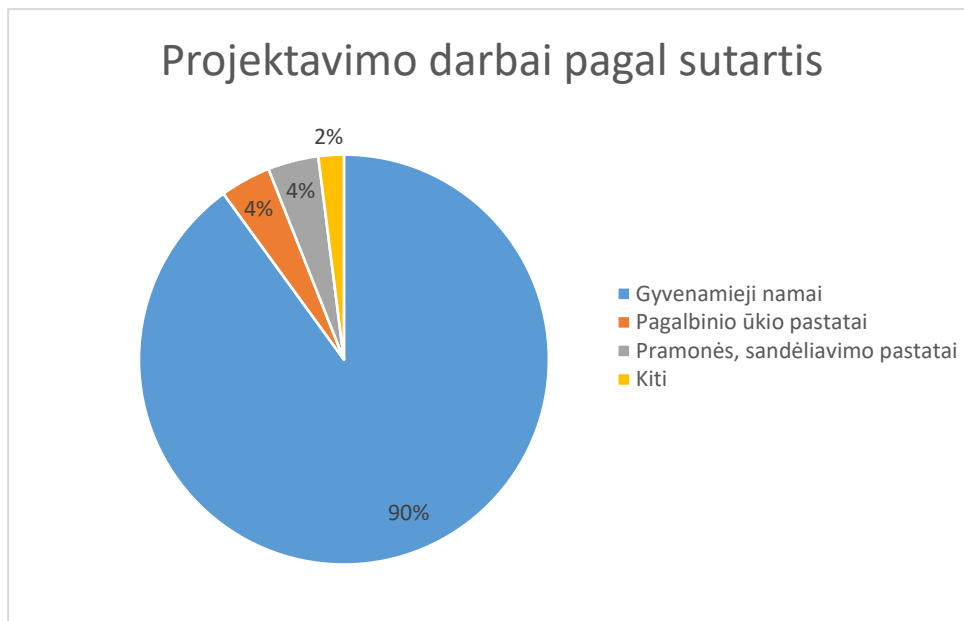
Diagrama Nr. 2

Pagal diagramą Nr. 2 matyti, kad 2024-aisiais metais vyravo gyvenamosios paskirties pastatų statybos, rekonstravimo, kapitalinio bei paprastojo remonto projektai, sudarę 90 procentų visų projektų. Pramonės, sandėliavimo, garažų paskirties pastatų projektai sudarė 4 procentus visų darbų. 2024 metais pagalbinio ūkio pastatų ir žemės ūkio sandėliavimo paskirties pastatų projektai sudarė 4 procentus nuo visų projektavimo darbų. 2 procentai projektavimo darbų buvo kiti projektai t. y. patalpų paskirties pakeitimai, pastatų dalinimai į atskirus turto vienetų, balkonų stiklinimai, butų sujungimai.