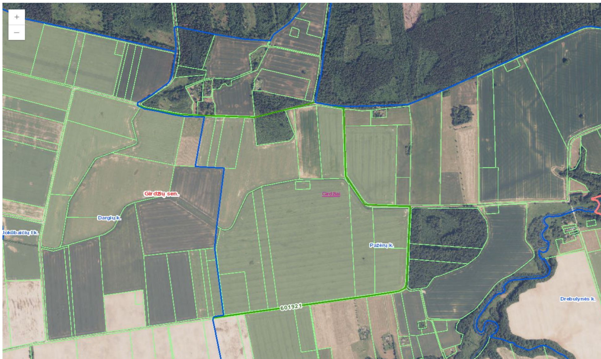
Gatvė pažymėta projektiniu Nr. 601921