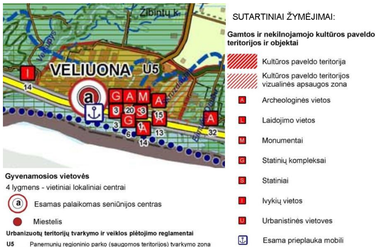
Pav. 5. Jurbarko rajono savivaldybės teritorijos bendrojo plano ištrauka (brėžinys – Žemės naudojimo, tvarkymo ir apsaugos reglamentai)