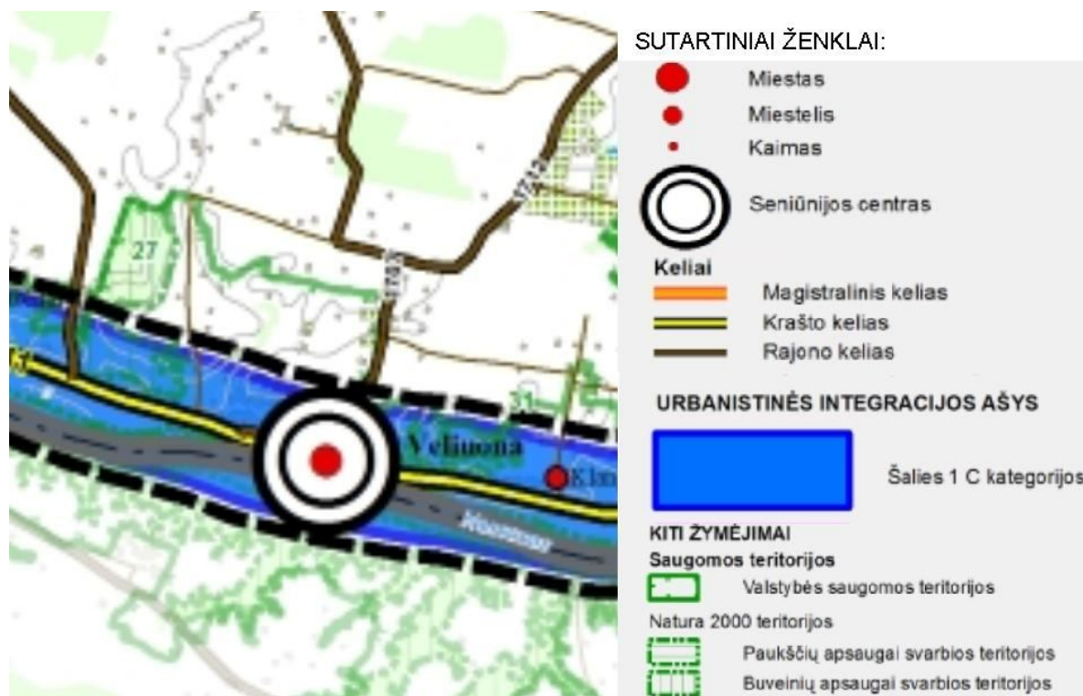
Pav. 3. Ištrauka iš Tauragės apskrities teritorijos bendrojo (generalinio) plano (brėžinys „Urbanistinė sistema“)

Pagal teritorijos naudojimo funkcinį prioritetą šis planas Raudonės - Veliuonos funkcinį prioritetų porajonyje numato prioritetą teikti KRu (konservacinis, intensyvus rekreacinis, dispersiškos urbanizacijos prioritetas).