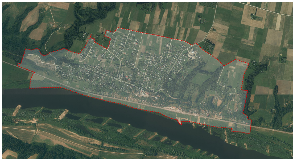
Pav. 1. Veliuonos miestelio esamos administracinės ribos

Planuojama teritorija yra apie 225,05 ha, kurią sudaro Veliuonos miestelis. Esamoji būklė - koncepcijos etapo išeities duomenys - buvo rengiama pagal esamus duomenis miestelio administracinėse ribose. Veliuonos miestelio bendrojo plano koncepcinis modelis įpinamas į bendrą seniūnijos, rajono, respublikos teritorijos kontekstą, siekiant užtikrinti darnią miestelio plėtrą visuose lygmenyse.