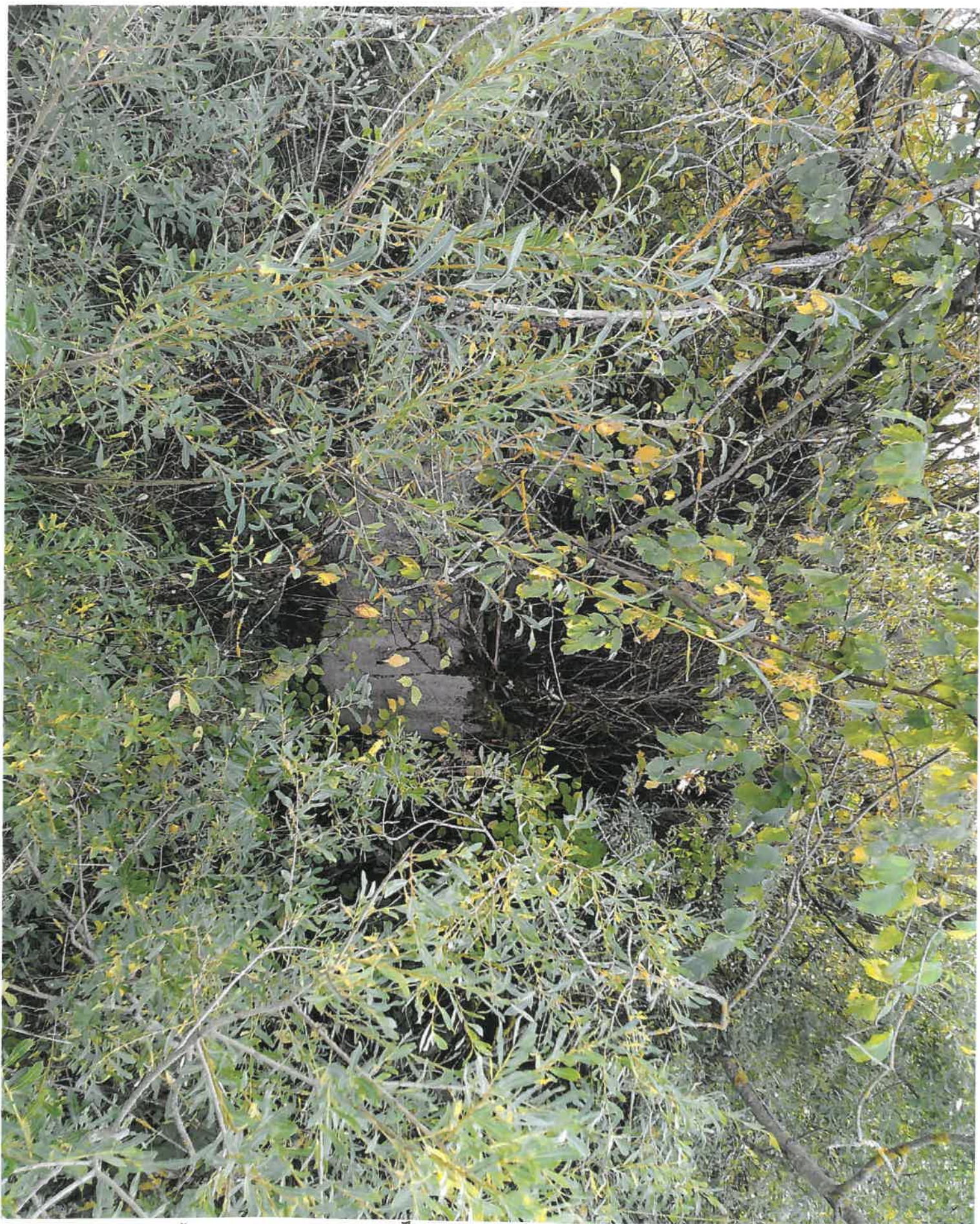
Valymo įrenginiai, Žindaičių k., Jurbarkų sen., Jurbarko r. sav.