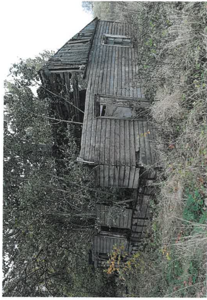
Administracinis pastatas, Seredžiaus g., Buriškių k., Seredžiaus sen., Jurbarko r. sav.