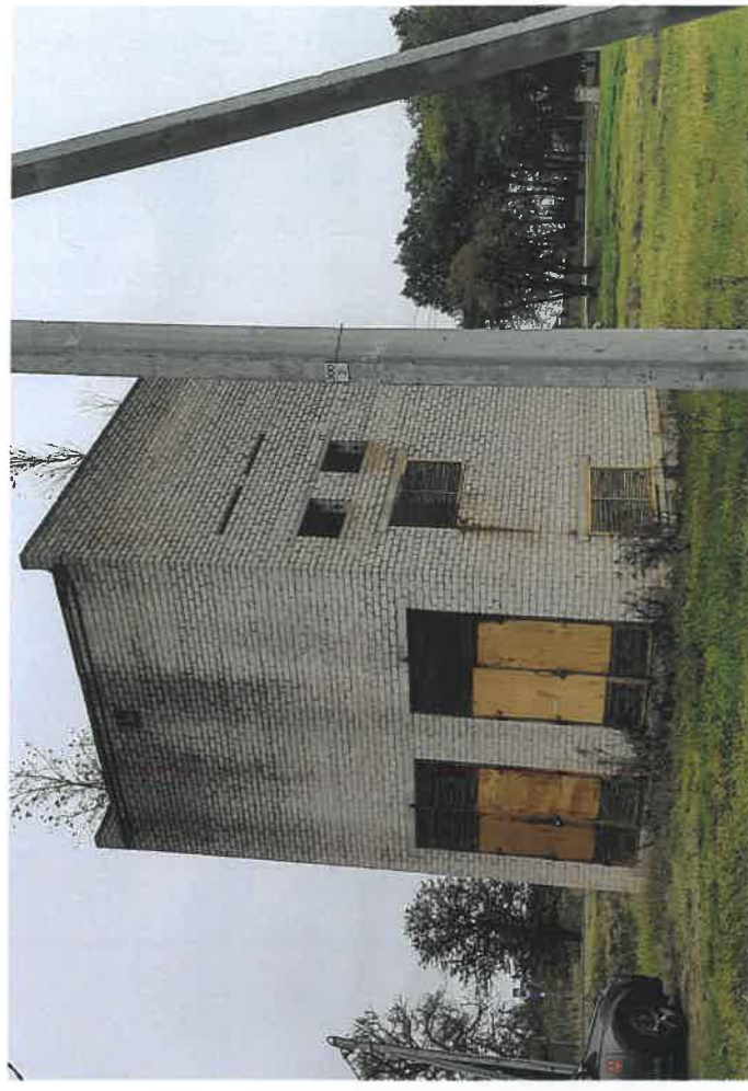
Elektros transformatorinė, Belvederio k., Seredžiaus sen., Jurbarko r. sav.