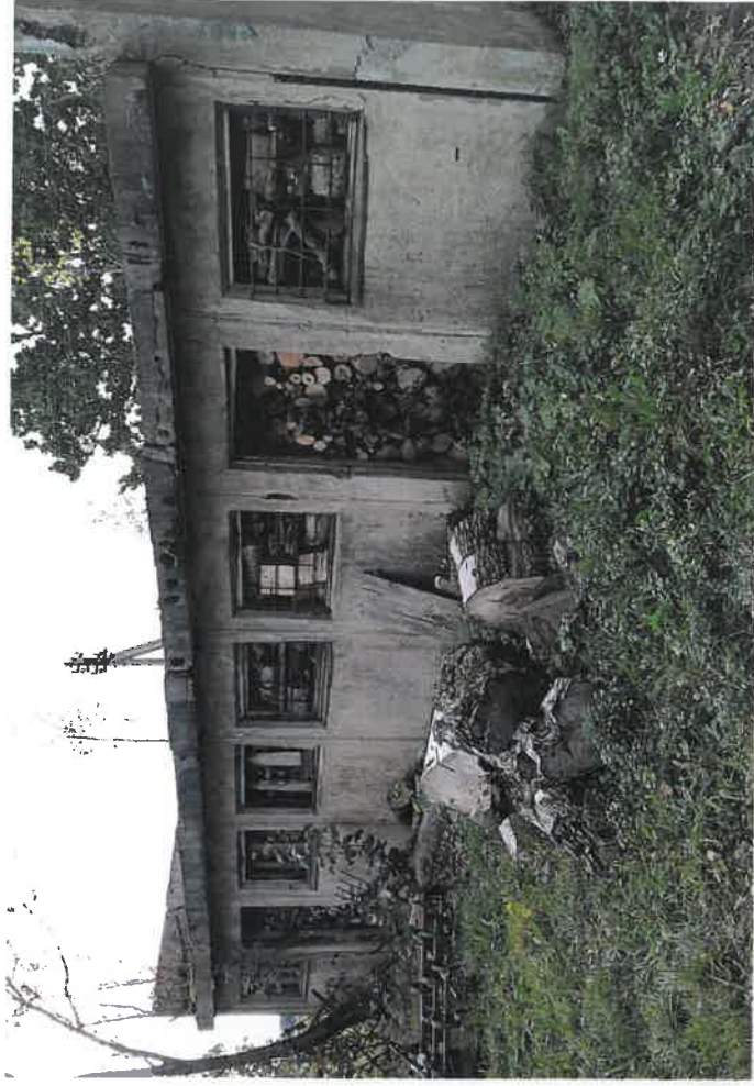
Parduotuvė su pagalbinio ūkio paskirties pastatu, Taubucių k., Eržvilko sen., Jurbarko r. sav.