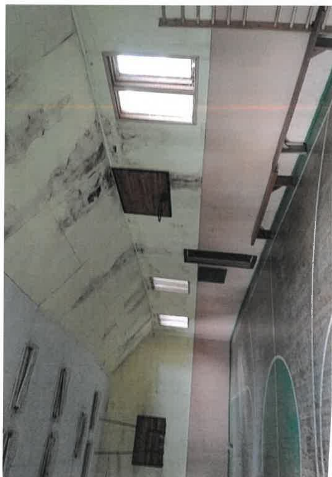
Sporto salė, Varlaukio k., Eržvilko sen., Jurbarko r. sav.