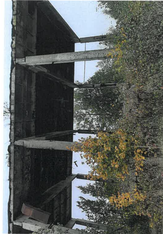
Kieto kuro katilinė, Klausučių k., Seredžiaus sen., Jurbarko r. sav.