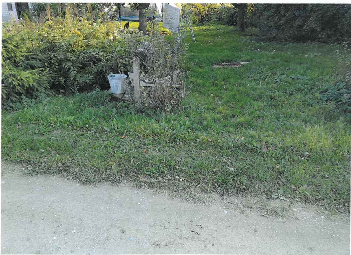
Gyvenamasis namas su ūkiniais pastatais, Gedžių k., Jurbarkų sen., Jurbarko r. sav.